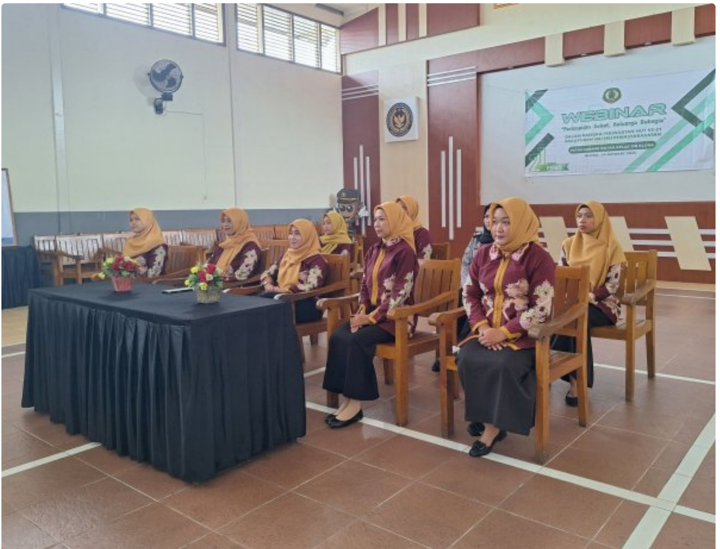
Peringati HUT ke-21, PIPAS Rutan Blora Ikuti Webinar "Perempuan Sehat, Keluarga Bahagia"